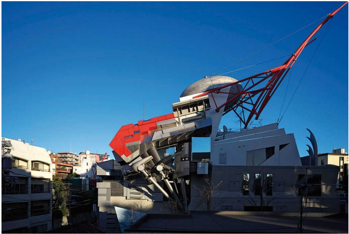
Uniwersytet w Tokio (Japonia)