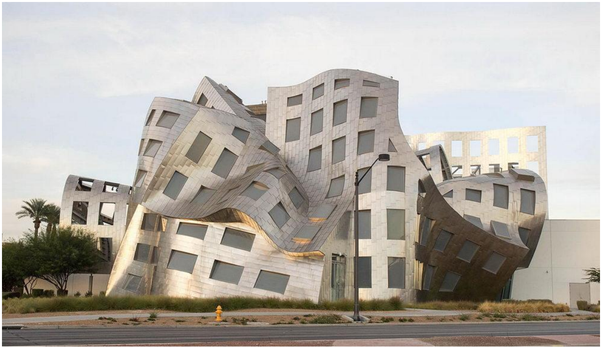
Szpital w Las Vegas (USA)