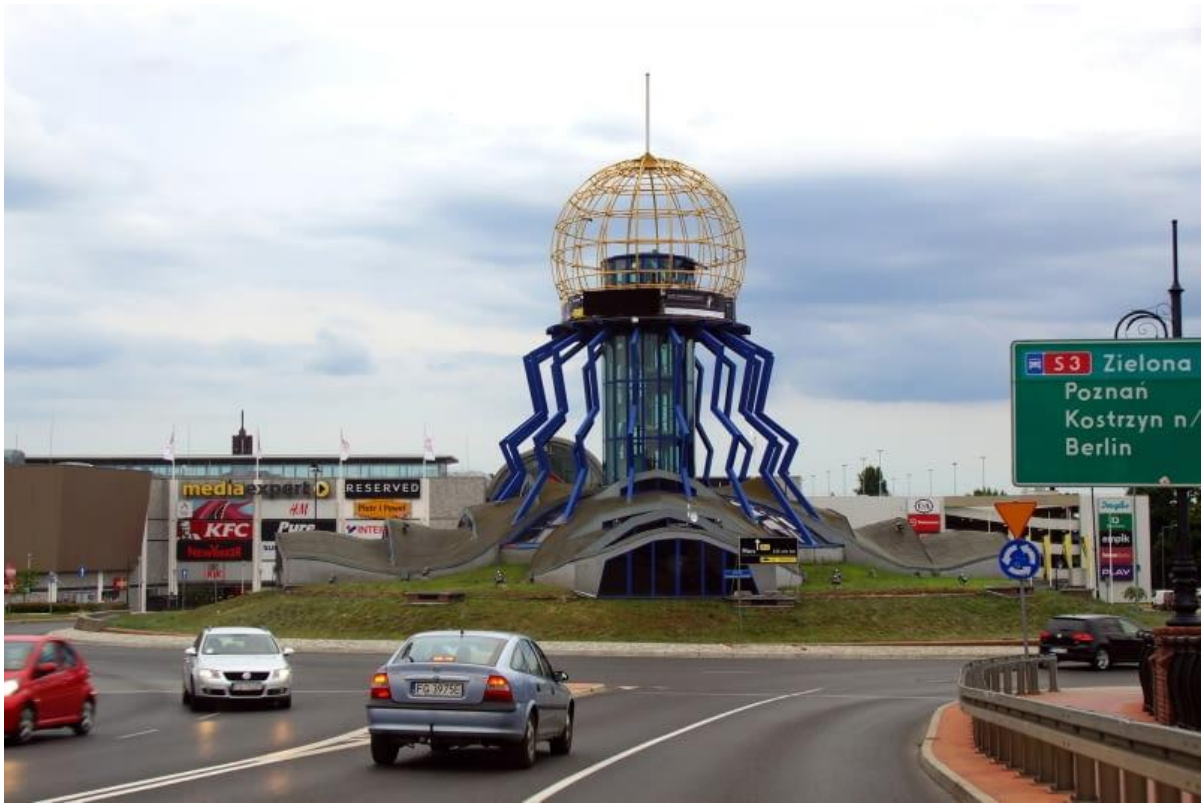
Wieża widokowa w Gorzowie Wielkopolskim (Polska)