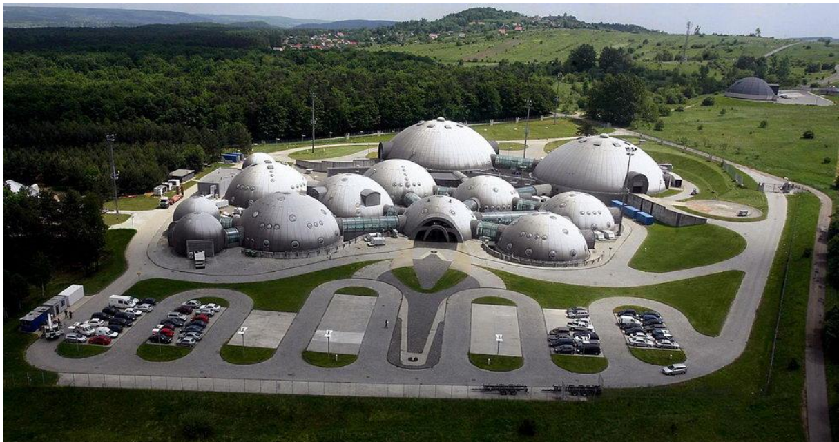
Studio filmowe w Alwerni (Polska)