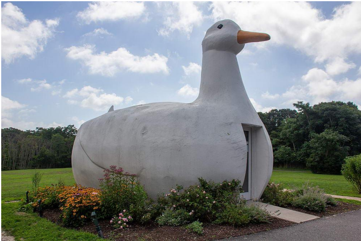
Sklep w Long Island (USA)