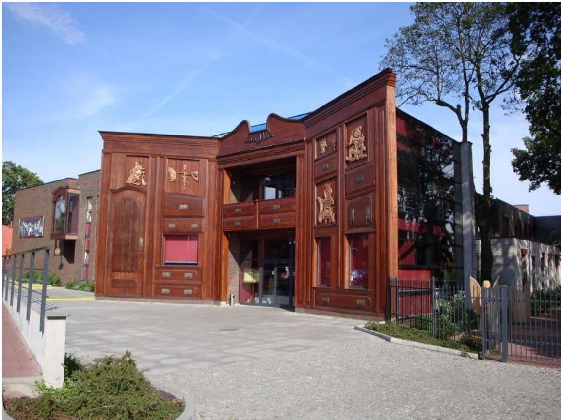
Teatr w Toruniu (Polska)