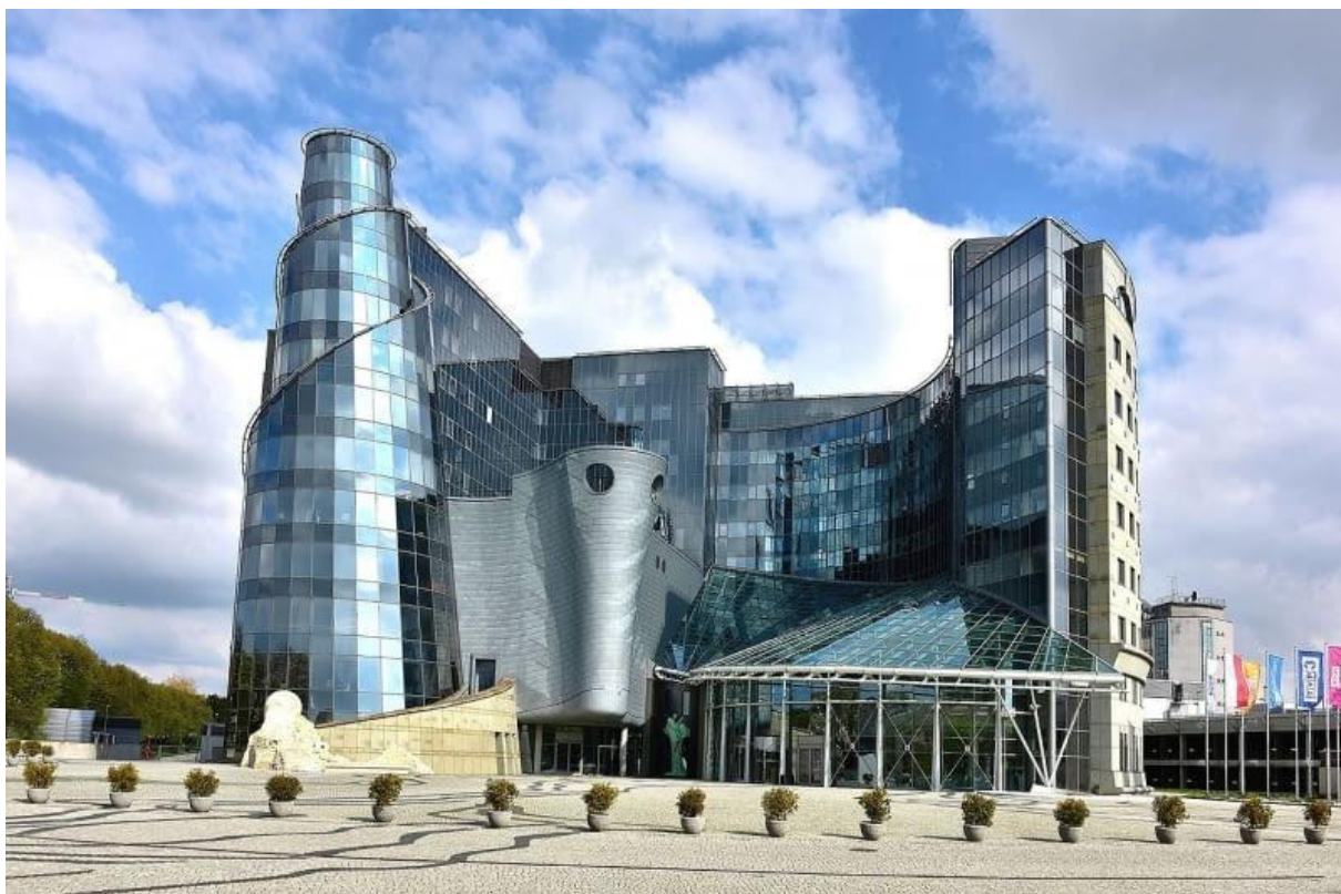
Budynek Telewizji Polskiej w Warszawie (Polska)