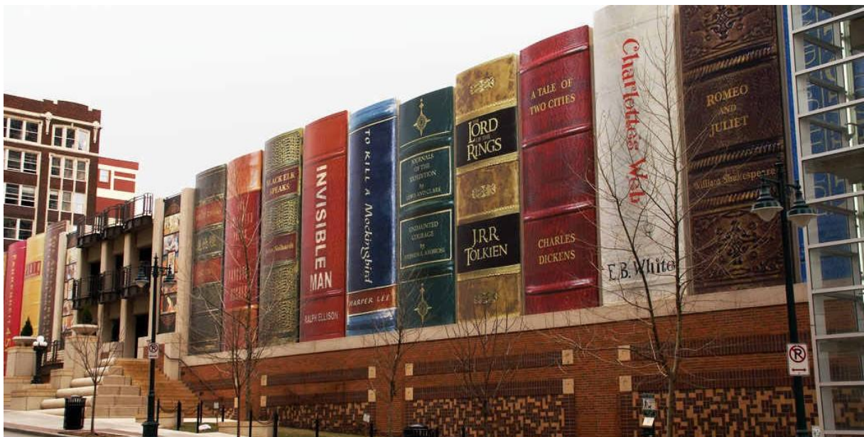
Biblioteka w Kansas (USA)