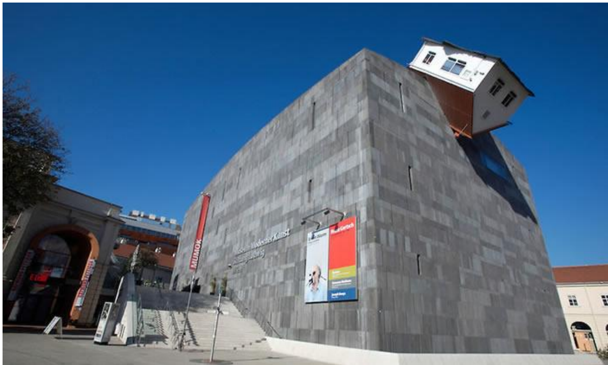
Muzeum w Wiedniu (Austria)