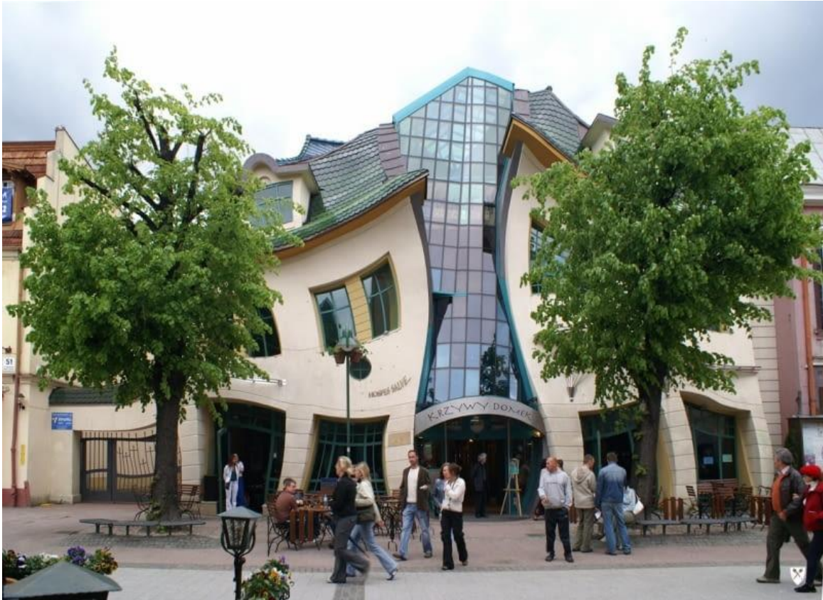
Krzywy Domek w Sopocie (Polska)